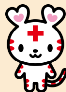
日本赤十字社 公式キャラクター 「ハートラちゃん」

【お問い合わせ・お申込み】Tel：092-523-1173（平日9時～17時30分）