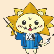
日本司法書士会連合会 公式キャラクター 「しほ〜しし」